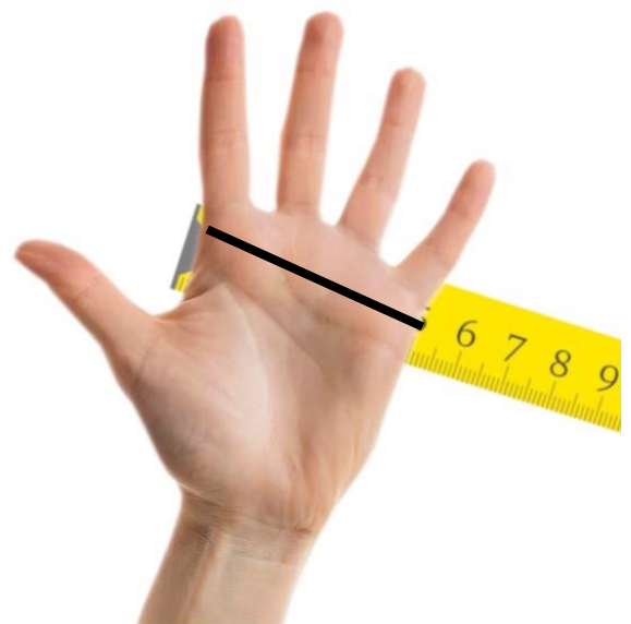
Posizionare il metro solo sopra le nocche